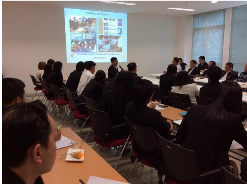
รูปที่ 3.3 การประชุมชี้แจงรายละเอียดของโครงการกับผู้อำนวยการ โรงเรียน

ผลการคัดเลือกโรงเรียน มีโรงเรียนที่ได้รับการคัดเลือกจำนวน 21 โรงเรียน สรุปได้ดังนี้