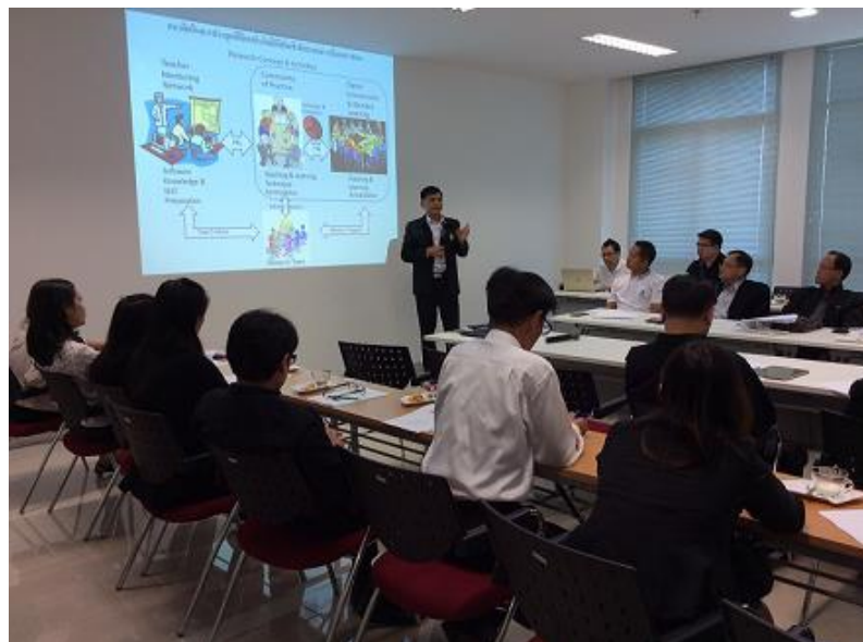
รูปที่ 3.2 การประชุมชี้แจงรายละเอียดของโครงการกับผู้อำนวยการโรงเรียน

ซึ่งการคัดเลือกจะพิจารณาจากความสนใจของโรงเรียนที่จะพัฒนาตนเองและมีความสมัครใจที่จะเข้าร่วมโครงการ โดยคณะผู้วิจัยได้เชิญผู้บริหารโรงเรียนเข้ารับฟังการชี้แจงรายละเอียดของโครงการ เพื่อให้แน่ใจว่าทางโรงเรียนมีความตั้งใจที่จะพัฒนาตามวัตถุประสงค์ของโครงการ ก่อนที่โรงเรียนจะตอบรับเข้าร่วมโครงการ